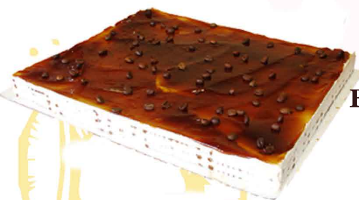
BOLO BOLACHA MOKA & CARAMELO