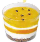
TROPICAL MANGA & MARACUJÁ