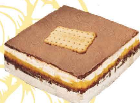
BOLACHA & CHOCOLATE D'AVÓ