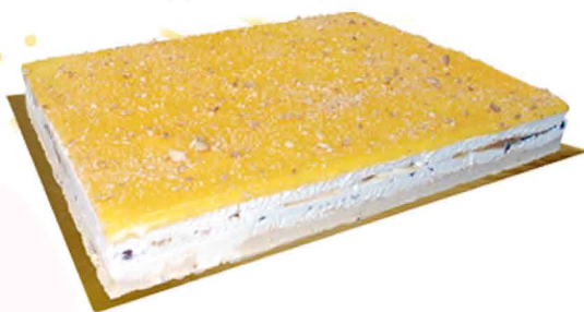
DOCE DA CASA