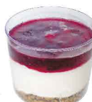
CHEESECAKE FRUTOS VERMELHOS