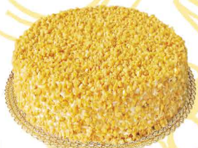
BOLO BOLACHA CROCANTE