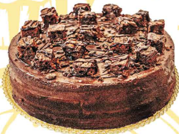
2 CHOCOLATES & BROWNIE