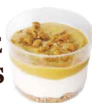
DOCE DE LEITE COM BOLACHA LÓTTUS