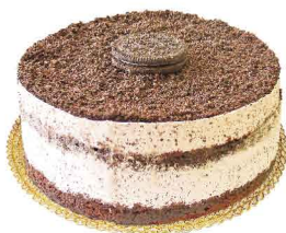
CHOCOLATE & CREME