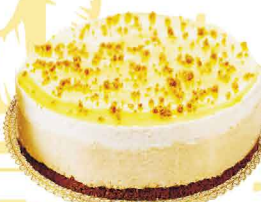
TARTE DE LIMÃO