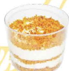
CENOURA & NOZES