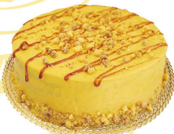
novidade CHOCOLATE CARAMELO SALGADO & CRUMBLE