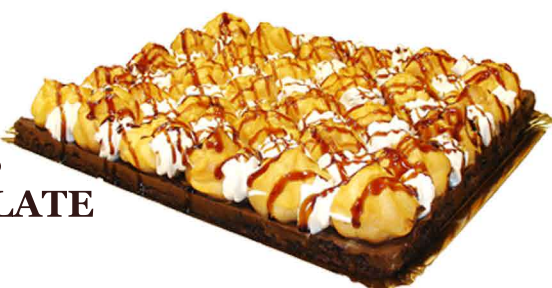
PROFITEROLES & CHOCOLATE