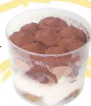
TIRAMISÚ NUTELLA & MASCARPONE