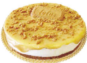
BOLACHA COM BOLACHA LÓTTUS & DOCE DE LEITE