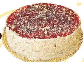
BOLO BOLACHA MOKA & CARAMELO