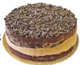
EXPLOSÃO DE CHOCOLATE