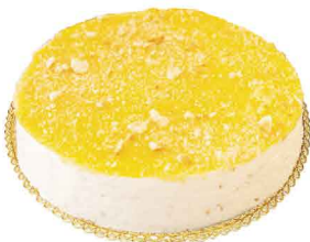
SEMIFRIO NATAS DO CÉU