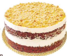
CENOURA & NOZES